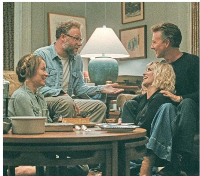
El elenco de "La Invitación": Olivia Wilde, Seth Rogen, Penélope Cruz y Edward Norton.