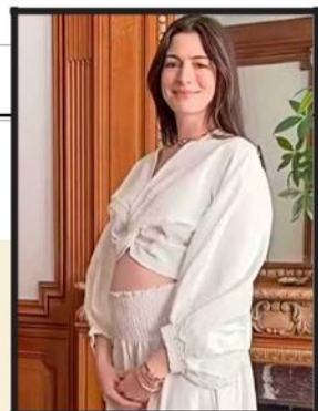
Anne Hathaway será madre por tercera vez