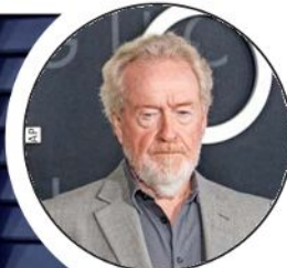
Ridley Scott ha sido nominado a la estatuilla cuatro veces.

integran una trayectoria de más de 60 años y que incluye filmes del impacto de “Alien” (1979), “Blade Runner” (1982), “Hannibal” (2001), “Gánster americano” (2007) y “El último duelo” (2021), entre otros, del cineasta a quien la Academia describió como “un verdadero visionario cuyo legado de décadas ha dejado un impacto incommensurable en el cine y la cultura global”.