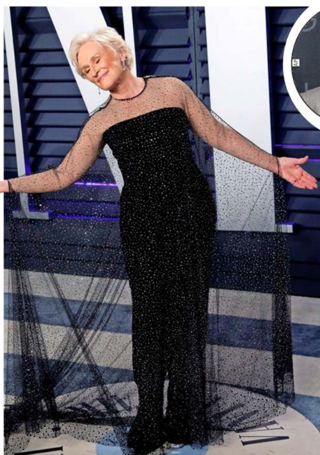
Glenn Close tiene ocho nominaciones al Oscar y nunca lo ha ganado.

La actriz y el director, quienes nunca han ganado la estatuilla, pese a sus múltiples nominaciones, recibirán el reconocimiento en noviembre.