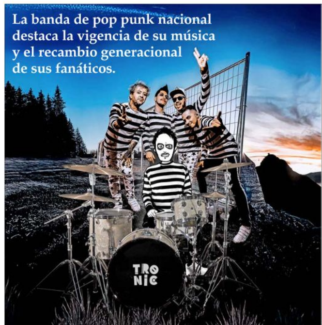
Los integrantes de Tronic señalan que cuando empezaron nunca imaginaron el alcance que llegarían a tener.

res detrás de cada espectáculo. Chavín señala que, cuando comenzaron, nunca imaginaron el alcance que llegarían a tener. Su primer disco, “Ke Patine la Risa”, estaba repleto de referencias lúdicas y chistes internos, ya que no creían que su música fuera a sonar en la radio ni a vender 15 mil copias, que fue lo que ocurrió.