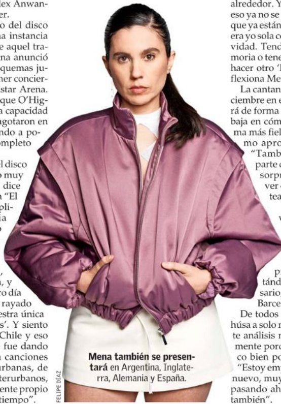
Mena también se presentará en Argentina, Inglaterra, Alemania y España.

De todos modos, la cantante se rehúsa a solo mirar al pasado. “Todo este análisis me sirve mucho creativamente porque quiero hacer otro disco bien potente”, cuenta y agrega: “Estoy empezando a trabajar en uno nuevo, muy inspirada en lo que está pasando hoy, en la gente y en mí también”.