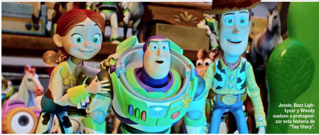
Jessie, Buzz Lightyear y Woody vuelven a protagonizar esta historia de "Toy Story".