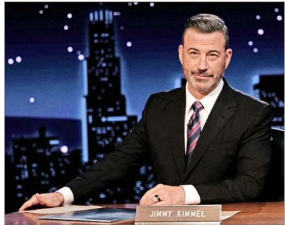
El programa de Jimmy Kimmel ha sido uno de los blancos de las críticas del presidente de la FCC, Brendan Carr.

La razón oficial de la FCC es que llevan adelante una investigación para ver si ABC ha cumplido con sus obligaciones como un medio con licencia. “Específicamente, la FCC ha estado investigando a ABC de Disney por posibles violaciones al Acta de Comunicaciones de 1934 y las reglas de la FCC, incluyendo la prohibición de discriminación ilegal”, dice el documento. Esto sería respecto de a los espacios de diversidad e inclusión de la compañía,