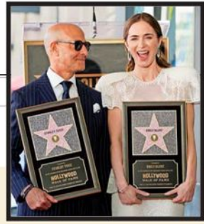
Emily Blunt y Stanley Tucci ya están en el Paseo de la Fama de Hollywood