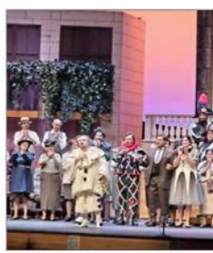
"I Pagliacci" se presentó en el Teatro CorpArtes.

En suma, dos sólidas producciones de óperas de entrañables fibras.