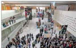
El espacio recibe anualmente a un numeroso público.

En 2026 el Centro Cultural La Moneda celebra 20 años de vida y ayer anunció su programación aniversario. Esta incluye una colaboración con la Cineteca Nacional, “Del cine en Chile a la IA generativa”, una exposición con más de 500 piezas del cine chileno. Otras novedades para este año son la Fiesta de la Lectura, obras de la 36ª Bienal de São Paulo, proyectos del Museo de Qatar y una exposición del Bicentenario de Chiloé.