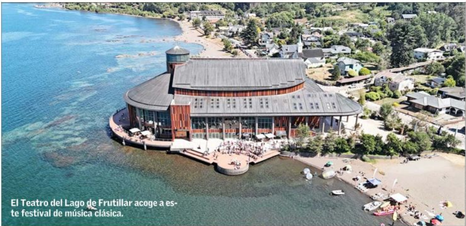
El Teatro del Lago de Frutillar acoge a este festival de música clásica.

Hoy parte la edición número 58 del principal evento musical del verano y que sumará a las agrupaciones más relevantes del país.