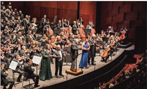
La Orquesta Sinfónica Nacional de Chile regresará a la cita con dos conciertos, el lunes 2 y miércoles 4 de febrero.