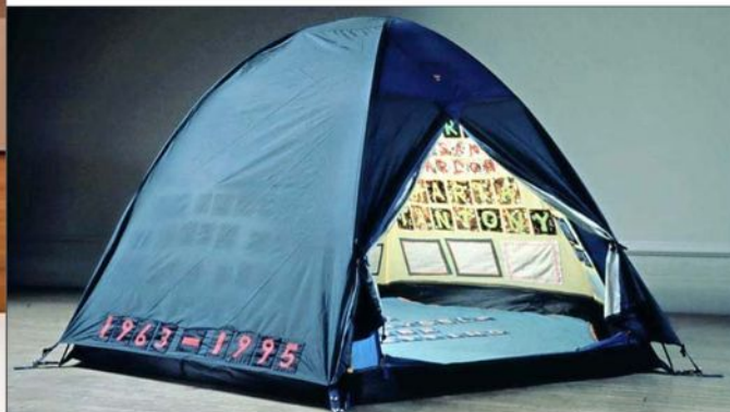
"La carpa" de Tracey Emin. Ahora en Tate Modern mostrarán además su nueva faceta más sensible y dolorosa.