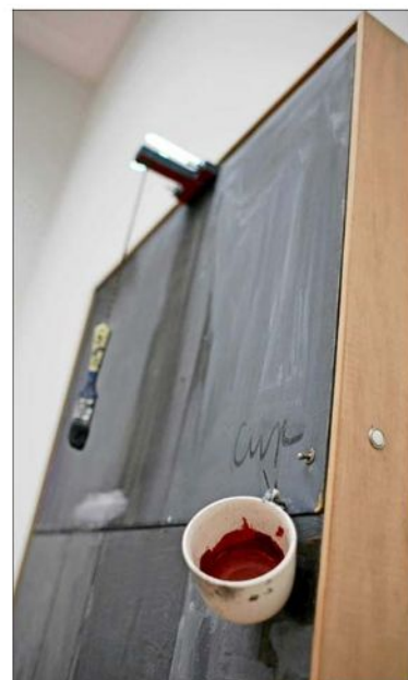
Jasper Johns, el influyente artista clave para el pop, el minimalismo y el arte conceptual.

Pero, además, el Guggenheim anuncia otras potentes muestras de Steve McQueen, del minimalista Dan Flavin y una exposición de la videasta suiza experimental Pipilotti Rist, con sus provocadores trabajos como aquel icónico filme en donde ella camina por las calles de la ciudad con una varita mágica rompiendo espejos retrovisores de autos en medio de un luminoso colorido de su estética pop. Dos pequeñas muestras de ella —quien protagoniza una sala del MoMA—, estuvieron también en Santiago 2025, en galería Machina de la PUC y durante la 17 Bial de Artes Mediales. Tan lejos parece tal vez que no estamos de la escena global contemporánea.