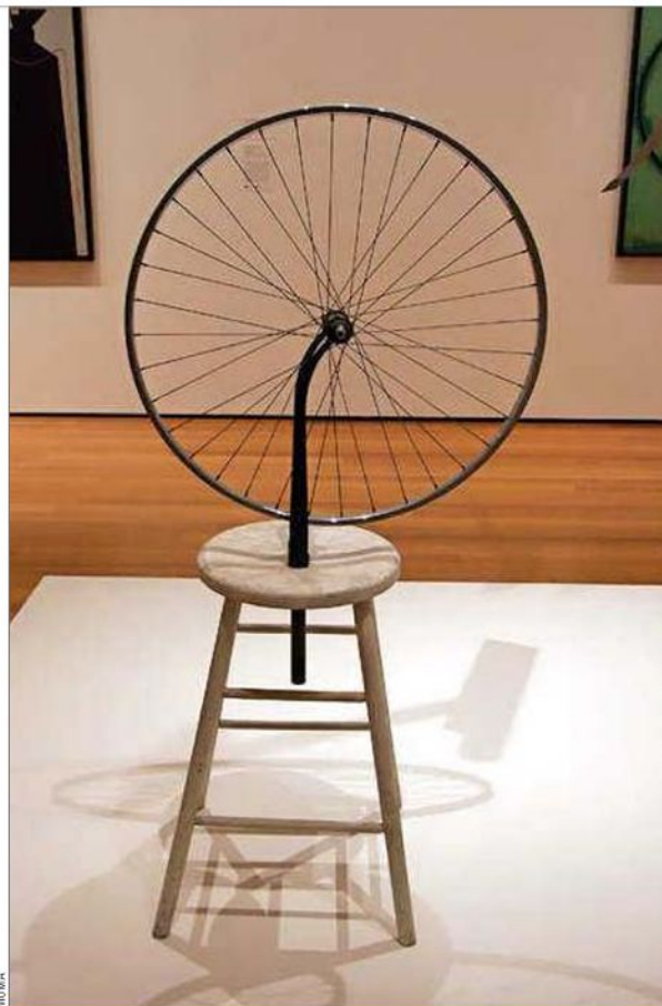
Duchamp: Rueda de bicicleta (1914), primer ready-made que hizo para crear una "escultura" desafiando la definición tradicional de arte.

Todavía en invierno y tal vez con nieve, como en estos días, el Metropolitan Museum de Nueva York abre en marzo una completa retrospectiva con más de 200 obras del maestro renacentista, Rafael Sanzio, entre pinturas, dibujos y tapices provenientes de varios museos del mundo. La exposición tendrá dos características especiales: será solo montada para el Met a pesar de su envergadura, y su curaduría está a cargo de una experta chilena, la curadora del departamento de dibujos y grabados del museo, Carmen Bambach, la misma autora de una de las mayores investigaciones sobre Leonardo da Vinci y curadora de la muestra sobre Miguel Ángel en 2017. Siete años le tomó preparar ahora esta megaexposición. El director del museo afirma que ofrecerá "una mirada innovadora a la brillantez y legado de Rafael". El público podrá experimentar la variedad de su genio renacentista con su perfección estética a través de pinturas que raramente se prestan, con secciones temáticas y diferentes tipos de imágenes, como su representación de las mujeres, entre las que estará "Retrato de una dama con unicornio"; también "Retrato de Baldassarre Castiglione" o la hermosa "La virgen y el niño con san Juan Bautista", entre muchas que develan su extraordinaria capacidad de sintetizar los ideales clásicos y humanistas, con una belleza y profunda emoción humana.