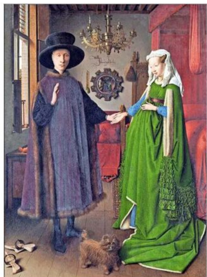
Van Eyck: "Matrimonio Arnolfini", 1434. Se le atribuyó la invención de la técnica al óleo.