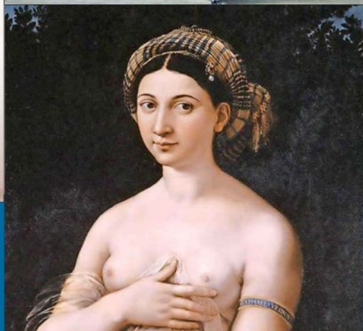
Rafael, "La Fornarina" sobresale por su sensualidad y misterio. Se cree corresponde a Marguerita Luti, su gran amor.