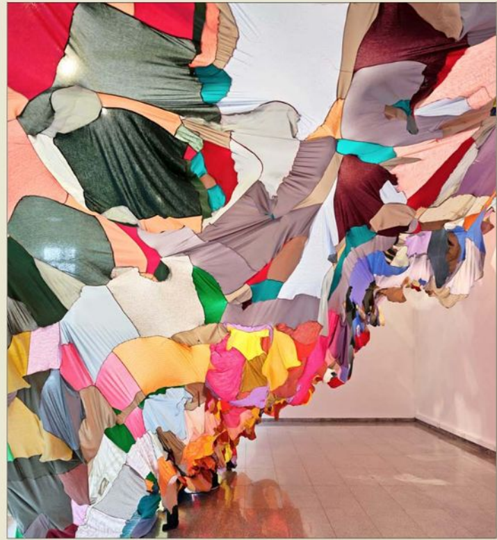
En el monumental manto textil de la artista Maite Izquierdo participaron más de 20 comunidades de mujeres..