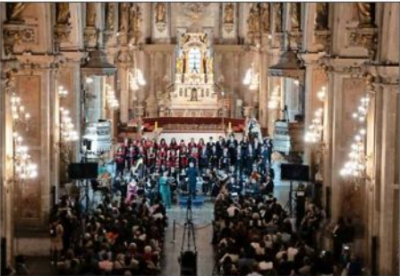
“Oratorio de Noël”, Op. 12 de Camille Saint-Saëns, se presentó en la Catedral de Santiago.