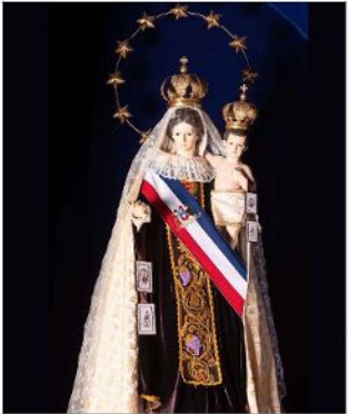
La imagen venerada con su ropa. Data del siglo XIX y vendría de Italia.

glo XVI se veneraba a la Virgen en ese sector de la Pampa del Tamarugal, y desde mediados del siglo XVIII comenzó la expansión del culto y la formación del santuario. “En el siglo XIX, este experimentará un importante desarrollo por el incremento de bailes religiosos que surgen en el ambiente salitrero nortino”, comenta Aguilera.