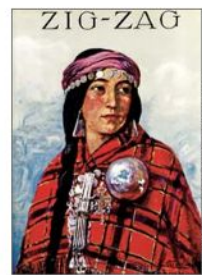
Portada de 1960. Zig-Zag tuvo 3.102 ediciones.

Hasta principios de agosto estará abierta en la Galería de Cristal de la Biblioteca Nacional la muestra "La gran revista chilena: 120 años de la revista Zig-Zag", que recorre la historia de esta publicación, en la que se reunieron destacados nombres de la literatura, el periodismo y la ilustración, y se distribuyó en toda América Latina. Fundada por Agustín Edwards Mac Clure, el primer número de Zig-Zag se publicó el 19 de febrero de 1905 con un valor de 20 centavos, y el último, en septiembre de 1964.