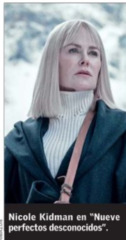
Nicole Kidman en "Nueve perfectos desconocidos".

Antes de que Kidman regrese a la pantalla chica, será el turno de Amanda Seyfried, quien mañana debutará en Max con "Long Bright River", una miniserie de ocho episodios en la que encarna a una