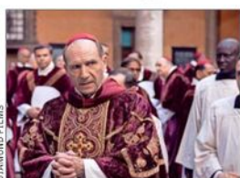
Ralph Fiennes protagoniza la exitosa "Cónclave".

Además de la cinta protagonizada por Ralph Fiennes, ganadora de un Oscar a comienzos de este año, otras han explorado este proceso secreto. "Las sandalias del pescador" y "Habemus Papam" están entre las más emblemáticas.