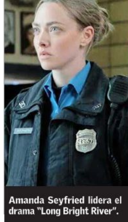
Amanda Seyfried lidera el drama "Long Bright River".

policía de Filadelfia que patrulla en uno de los vecindarios con más altos niveles de crímenes en la ciudad. Varios asesinatos de mujeres del área la llevan a investigar la posible conexión con la desaparición