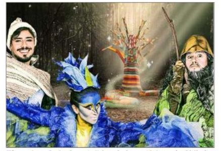
El vestuario incluye tejidos de lana, típicos de Chiloé.