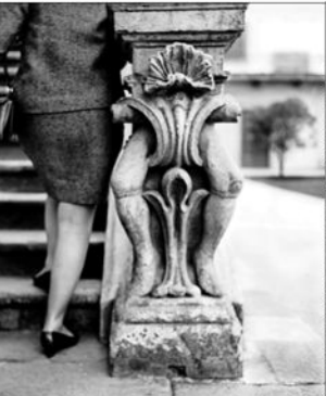
Instantánea tomada en La Moneda en 1970.

publicación se lanza el 1 de agosto y pronto llegará a librerías. Asimismo, se puede consultar en Bibliotecanacional.gob.cl .