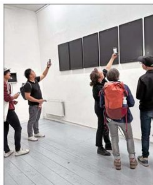
Durante el festival en Berlín el público interactúa con sus obras, que se iluminan y cambian sus imágenes con el flash.

ga muy cercana de Friedrich Nietzsche, quien estuvo enamorado de ella, al igual que Rainer Maria Rilke, entre muchos otros. Mantuvo una estrecha relación colaborativa con Sigmund Freud y pasó a ser la primera mujer en ser aceptada en el círculo psicoanalítico de Viena. Y, para mí, su significado es una