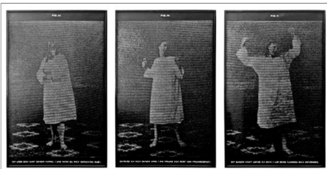
Salomé. Parte de una secuencia de su "Double vision" en honor a un poema de la rusa Lou Andreas-Salomé, muy cercana a Nietzsche y Rilke, quienes estuvieron enamorados de ella. Fue la primera mujer en ser aceptada en el Círculo Psicoanalítico de Viena.