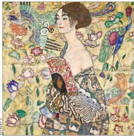
"Dama con abanico", 1918, de Gustav Klimt. El artista transforma a una mujer de la Viena de inicios del siglo XX en una geisha.

Habló del nuevo método creativo del régimen: "Imaginarse que un determinado artista hará una obra que debe ser censurada y se adelantan en tomar represalias por algo inexistente". También afirmó que el gobierno tiene asociación con algunas determinadas galerías para blanquear su imagen, "pero todo ello se invisibiliza. El régimen posee unos tentáculos enormes en el exterior. En mi caso, logró que no se realicen tres exposiciones más afuera de Cuba".