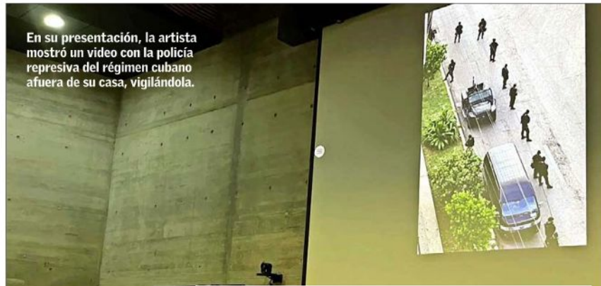
En su presentación, la artista mostró un video con la policía represiva del régimen cubano afuera de su casa, vigilándola.

La artista proyectó en la conferencia estremecedores videos sobre represalias contra la disidencia y artistas independientes; filmaciones de detención de