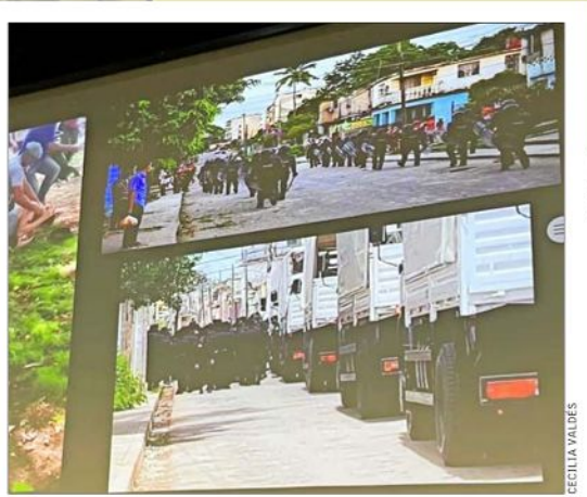
Bruguera mostró videos de la represión en Cuba. Son imágenes que la llevan a crear su arte y activismo.

Tania Bruguera (1968, hija de un alto personero del régimen castrista) dijo estar "actualmente desterrada" de Cuba, y se sabe que pasa temporadas en Berlín. Fundó el Instituto de Activismo Hannah Arendt, en La Habana, e impulsó lo que llamó "el Arte de la conducta". Sus performances e