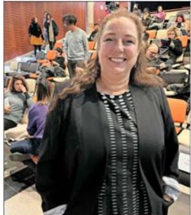
Tania Bruguera dijo estar "actualmente desterrada" de Cuba.

"A nosotros los cubanos nos es muy difícil hablar, porque no nos acompañan, no hay apoyo... Y tenemos una situación de terror en Cuba en la actualidad... Le pedimos, ahora, a la izquierda