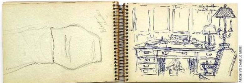
Entre los variados materiales del Archivo Camilo Mori hay también manuscritos y croquis.

El archivo contiene una diversidad de materiales. Además de los afiches y de variedad de documentos —600—, reúne más de 1.400 fotografías, entre positivos y negativos; casi 300 recortes de prensa y 90 catálogos. "La fa-