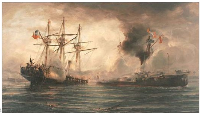
"Combate naval de Iquique". Había dibujado antes la Esmeralda y esta pintura lo consagró.

Es uno de los tres artistas de la historia del arte nacional más valorados en el exterior. Y se le considera el mejor marinista del país. La exposición que se abre en Lo Barnechea, el 2 de mayo, mostrará pinturas y dibujos, de colecciones públicas y privadas. En tanto, el próximo Consejo Constitucional sesionará ante un imponente cuadro de Somerscales.