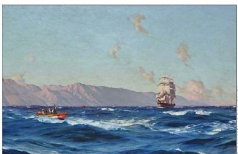
"Off Iquique". Sus barcos, veleros y batallas protagonizan la iconografía histórica.

"Es algo que ronda a toda la pintura chilena. Hay que difundir y transparentar la escena. En mi opinión, una manera de intentar acabar con las falsificaciones es conocer la procedencia. Los investigadores tratamos de hacer un trabajo fino y profundo para evitar una falsificación, pero desde los años 90 se omiten los nombres del propietario por motivos de seguridad".