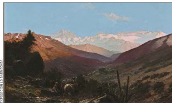
"Sierra Velluda", Somerscales. Sus pinturas de paisaje hablan de su recorrido por la geografía del país.