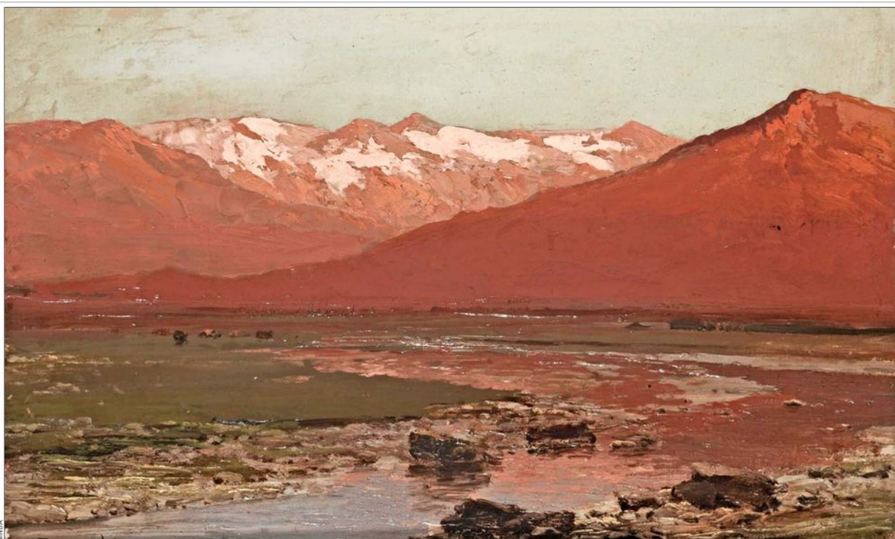
"Paisaje en rojo", 1888. El aporte plástico es notable en este género pictórico que cultivó Somerscales.

"Antes de él habían algunas obras de marinas, como esa conocida "Vista de Valparaíso", de Rugendas. Pero quien se ocupó de manera casi exclusiva al tema fue Thomas Somerscales. Sus pinturas tienen un valor iconográfico histórico. Él