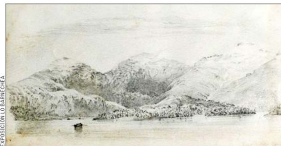
Dibujo de paisaje, anterior a su arribo a Chile. Se exhibirán varios de ellos.