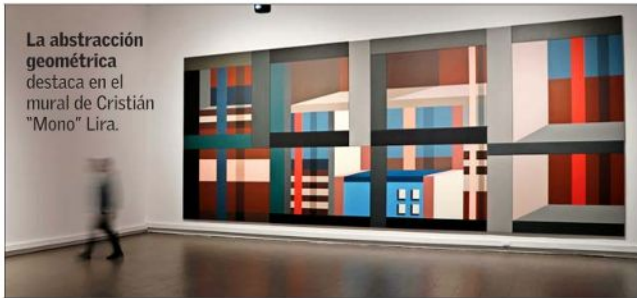
La abstracción geométrica destaca en el mural de Cristián "Mono" Lira.

Y entre los artistas invitados —la mayoría conocidos en la escena y con trayectoria— destaca Cristián "Mono" Lira con "Tiempo abstracto y paisaje urbano".