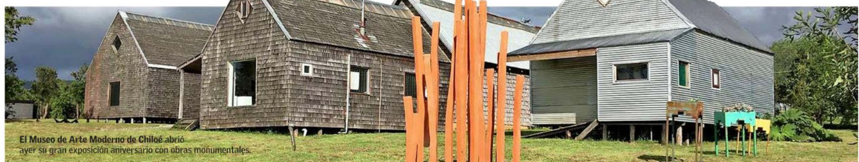
El Museo de Arte Moderno de Chiloé abrió ayer su gran exposición aniversario con obras monumentales.