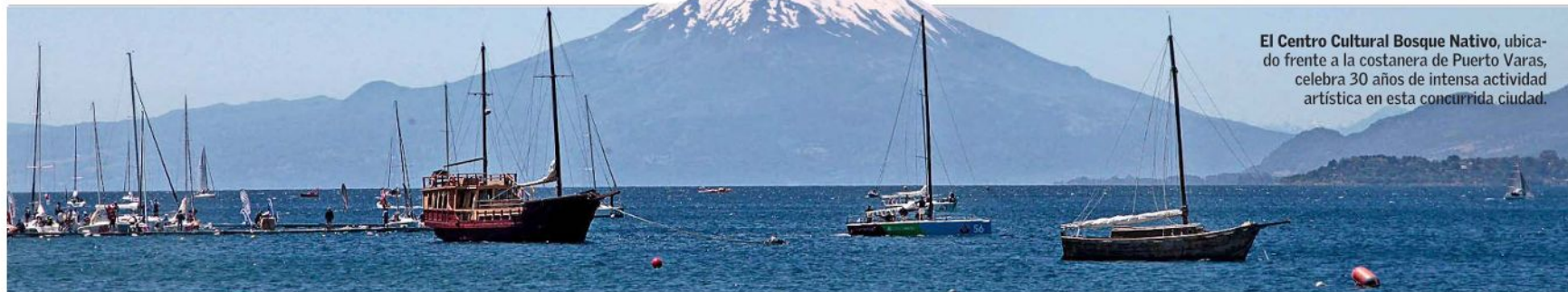
El Centro Cultural Bosque Nativo, ubicado frente a la costanera de Puerto Varas, celebra 30 años de intensa actividad artística en esta concurrida ciudad.

DE ANIVERSARIO | MAM y Centro Cultural Bosque Nativo