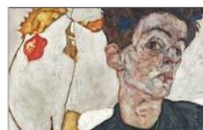
“Autorretrato con planta de linterna china”, de Egon Schiele.

Cuando voces constituidas por una combinación de letras y cifras obedecen a un proceso de prefijación, el uso de guion entre ambas es la norma. Se recomienda, pues, escribir sub-21 , ya que sub es un prefijo que significa, en este caso, “bajo o debajo de”.