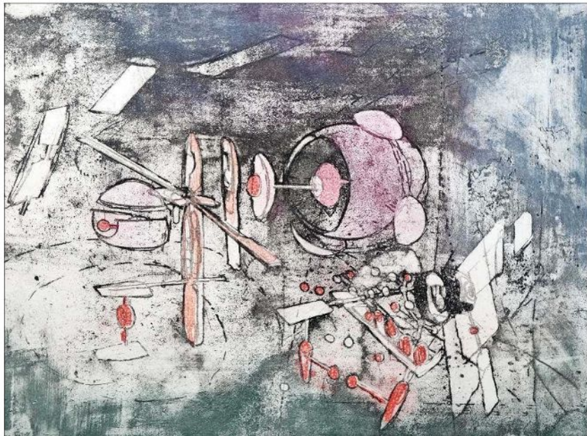
“Come detta dentro vo significando” (1962). Matta cita a la “Divina Comedia” de Dante.