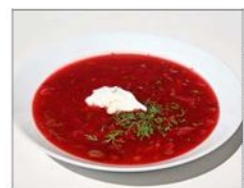
Borsch. La sopa agri dulce ya pertenece a la humanidad.