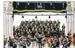
El Aula Magna Usach será otra vez el gran escenario.

Confeccionada a base de remolacha, repollo, papas, tomate, carne y la crema agria denominada smetana , la sopa borsch ucraniana ingresó ayer con carácter de urgencia a la lista de Patrimonio Cultural Inmaterial de la Unesco. La decisión se tomó dada la amenaza del desplazamiento de la población que conoce la receta. "Las personas no pueden ni siquiera cocinar o cultivar las verduras que lleva el borsch . Y tampoco pueden reunirse para comerlo y eso amenaza el bienestar social y cultura de la comunidad", señaló la Unesco. La sopa, que se conoce y se consume en otras regiones de Europa oriental, como Polonia, es reivindicada como propia por Rusia, país que argumenta que cuando se empezó a preparar masivamente no existían ni Rusia ni Ucrania, sino el reino eslavo de la Rus de Kiev.