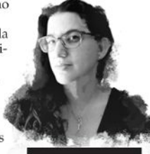
la columna de María José Navia

La efervescencia del lenguaje llega también en la obra de Irene Solà (1990), especialmente en su novela Canto yo y la montaña baila (Anagrama, 2019), en la cual se entrelazan historias de personajes