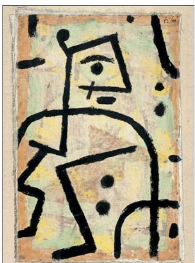
"Soldado", 1938. Con solo unas pocas líneas y el punto hizo este dibujo que inspira hoy la exposición.

Procedente del Zentrum Klee de Berna —el museo más importante del mundo dedicado al artista suizo alemán—, el Centro Cultural La Moneda inaugura el martes la primera retrospectiva del maestro en nuestro país. Ochenta obras originales, además de objetos, videos y cortometrajes expondrán —en una cuidadosa y seductora muestra— sobre la creatividad, biografía y procesos del autor. Se desconoce mucho de él, pero leyó su tiempo convulso a través de síntesis, esencialidades y con ironía, en una propuesta muy libre que adquiere especial actualidad.