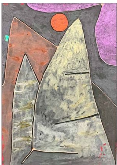
Sobresale la belleza y síntesis que alcanza en sus últimos años (1940).