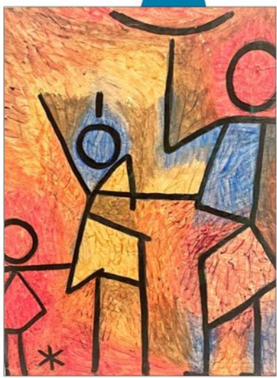
Klee. Una de sus obras pictóricas (sin título) que seduce en la inédita retrospectiva, 1940.

el artista que dibujaba lo que la gente no ve