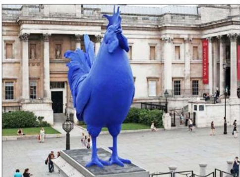
Katharina Fritsch también recibirá el León de Oro. Sus objetos monumentales juegan con la ilusión óptica y los sueños.