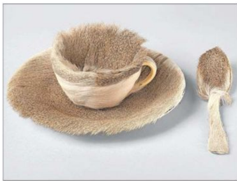
La vanguardista suiza Meret Oppenheim remeció con "Juego de desayuno de piel".