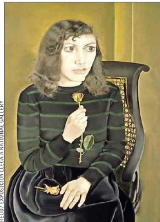
Lucien Freud: "Niña con rosas". Protagonista del regreso a la pintura.