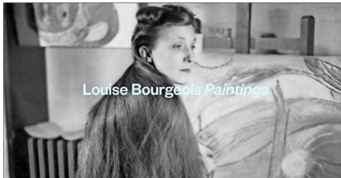
El Metropolitan Museum anuncia su gran muestra con las desconocidas pinturas de Bourgeois, claves para su inquietante imaginaria visual y psicológica.