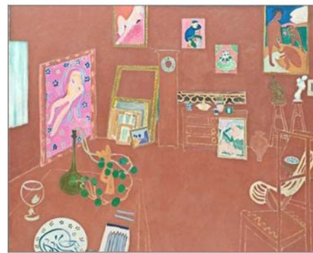
Matisse y su "Pieza de estudio roja" en la que incorporó los objetos de su taller.