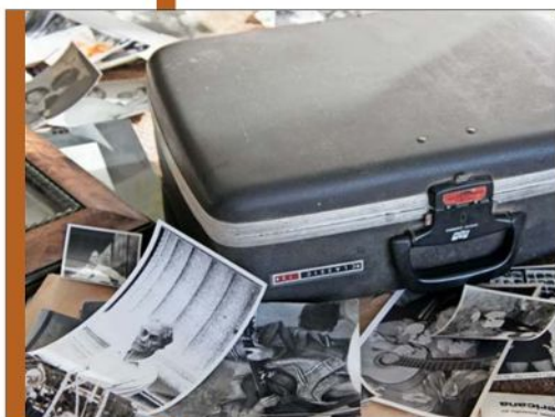
Hay numerosas fotografías del antipoeta, muchas de ellas inéditas.