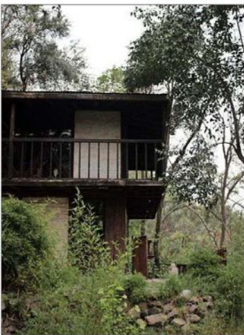
El autor de “Versos de salón” adquirió la propiedad de la Reina en 1958.