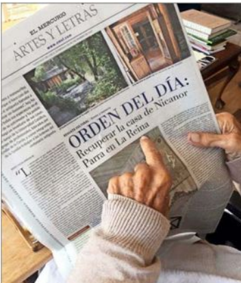
El autor de “Poemas y Antipoemas” lee un artículo de 2017 de “Artes y Letras”.