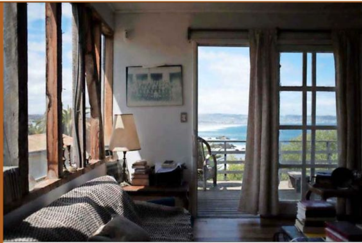
Imagen de la casa de Las Cruces. Con el dinero que obtuvo al ganar el premio Juan Rulfo, Parra adquirió esta residencia donde recibió a estudiantes y a escritores como Roberto Bolaño.

Carlos Peña, rector de la Universidad Diego Portales (UDP) y miembro del directorio de la Fundación Nicanor Parra, manifiesta a “Artes y Letras” que desde su punto de vista, la obra de Parra no es puramente intelectual o poética en el sentido convencional de esta última expresión, “sino que atinge a la forma en que la palabra y la acción ‘abren un mundo’. Esto explica que la materialidad de su obra y de los lugares que él imaginó hasta traerlos a la realidad deban tratarse conjuntamente con el contenido intelectual o eidético de la misma”. La autoridad de la UDP añade que sus antipoemas, los artefactos, las banderitas de La Reina y sus casas “pueden ser vistos como indagacio-