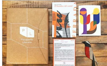
Pioneros: en 2019 Pasaporte Literario inició el sistema de suscripciones mensuales en el país.

Es una ruta complementaria a las librerías, que busca a lectores inquietos: la suscripción de agosto de Pasaporte Literario incluía la novela “Los estratos”, del colombiano Juan Cárdenas (de los sellos locales Montaceros y Banda Proja), un pieza gráfica de Paulina Saavedra y una ilustración de Cheltehue Ediciones. Cuando llegaba esa caja a sus suscriptores, arribaba paralelamente el segundo envío de los debutantes Somos Impreso, quienes siguen una idea parecida: todos los meses envían un paquete con un libro de un autor