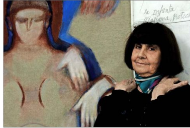
Una exposición en el Museo del Grabado de la Universidad de Playa Ancha recordará a la artista Roser Bru, fallecida este 2021.

El 7 de octubre se dará a conocer toda la programación y comenzará la venta de entradas, que vuelven