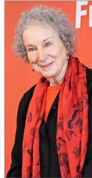
La escritora canadiense Margaret Atwood estará de forma telemática en el festival.

De los nombres que se adelantó ayer está el de la escritora canadiense Margaret Atwood. La autora de “El cuento de la criada”, novela distópica de gran éxito con influencias de George Orwell, llevada a la televisión y al cine, tendrá una conversación telemática con un interlocutor aún no definido. La Premio Príncipe de Asturias de las Letras 2008 —entre otros galardones y distinciones que ha recibido— estará accesible para el público chileno luego de que este año se publicaran en español “Oryx y Crake” y “El año de la