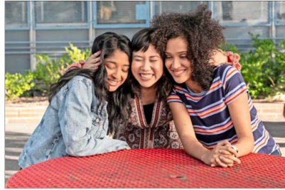
"Yo nunca...?", serie que narra las experiencias de una adolescente de ascendencia india y sus amigas, es producida por la comediante Mindy Kaling.

Uno de los puntos en común entre estas series que apuestan por la representatividad son las protagonistas femeninas empoderadas, modernas y complejas. Un ejemplo de esto es la recién estrenada