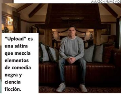
"Upload" es una sátira que mezcla elementos de comedia negra y ciencia ficción.