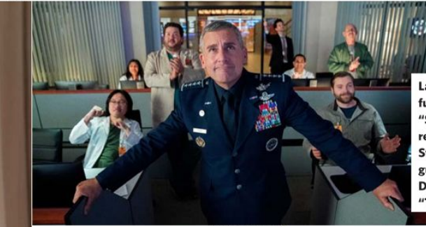
La comedia futurista "Space Force" reúne al actor Steve Carell y al guionista Greg Daniels, de "The Office".