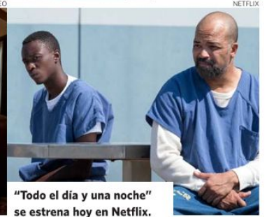
"Todo el día y una noche" se estrena hoy en Netflix.