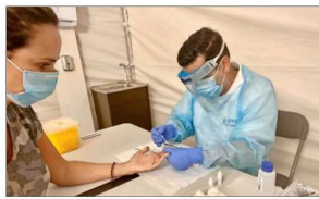
ayuden a salir adelante para que esta noche sea inolvidable".

En la ocasión, se informó que en diciembre recibieron el aporte de $5.500 millones de las empresas auspiciadoras y que han servido para que los centros de rehabilitación funcionaran los primeros meses del año, pero que aún hay