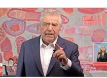
Un emocionado Don Francisco inauguró la Teletón desde su casa.

Quienes llegaron ayer hasta el Teatro Teletón debieron cumplir con un estricto protocolo, y el recinto que durante