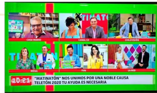
Durante 48 minutos los animadores de los matinales se comunicaron ayer en forma remota con Don Francisco para explicar las características que tendrá esta jornada solidaria.

Durante la transmisión matutina, que duró cerca de 48 minutos, Don Francisco informó que en esos momentos ya se habían realizado mil transacciones. En la Fundación Teletón señalaron que después de ese bloque televisivo se comenzaron a incrementar los aportes.