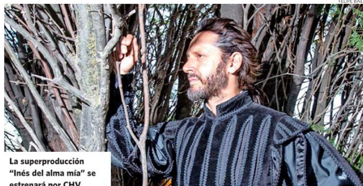
La superproducción "Inés del alma mía" se estrenará por CHV.