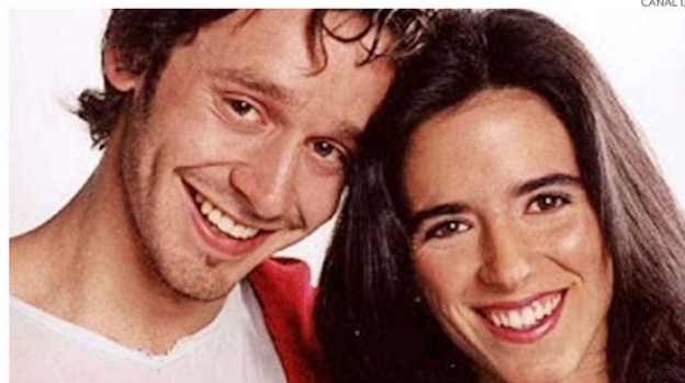
En 2001, protagonizó "Piel Canela" junto a su expareja Paz Bascuñán, con quien vuelve a trabajar en "Demente": "Tuvimos caminos y vidas diferentes, ambos somos padres, y creo que eso nos ha permitido aproximarnos a esta historia desde otro lado", dice.