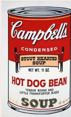
La icónica "Sopa Campbell" se remonta a su niñez: era su favorita.

Conoces a gente rica, te reúnes con ellos y una noche después de unas copas dicen que te comprarán obras... y les recomiendan a sus amigos que deben tener tu obra.