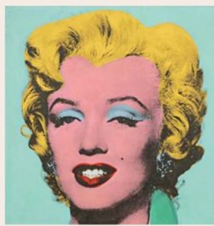
La Marilyn recién subastada contiene muchas singularidades y valor.