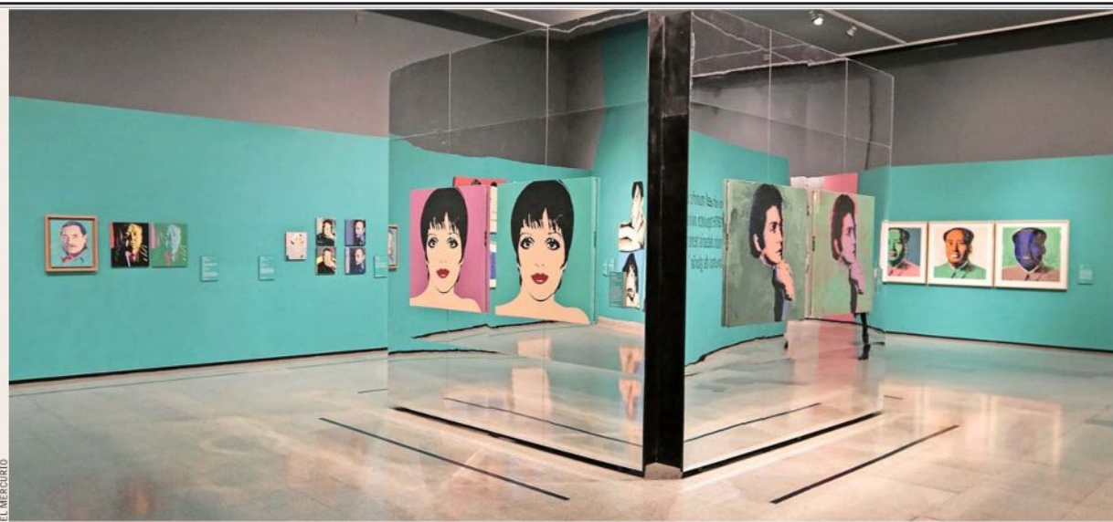
Decenas de retratos de Warhol a actrices, cantantes, mandatarios integraron también la antología en el Centro Cultural la Moneda, unos años atrás.

Andy Warhol empezó trabajando en Nueva York como artista gráfico y comercial, pero él insiste: "Me interesa hacer un arte serio". Nunca abandona su amor por la pintura y el dibujo a pe-