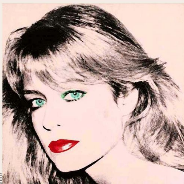
Revelan detalles de la sesión de Farrow Fawcett quien llegó muy natural a su estudio. A Warhol le gustó así y una señal es que le pintó los labios muy delimitados.

El ataque le dio una nueva perspectiva de la vida y el arte, pero no sin temor. El curador Jeffrey Deitch confiesa que Warhol tenía mucho miedo que le sucediera de nuevo. La recuperación fue muy larga y decidió dedicarse a escribir —en la revista que funda en 1969, Interview—, y a hacer sus famosos retratos por encargo. "Pareció recordar cómo pintaba a través de esos retratos". Ya había hecho a Marilyn, a