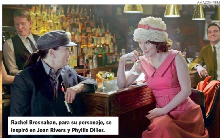
Rachel Brosnahan, para su personaje, se inspiró en Joan Rivers y Phyllis Diller.