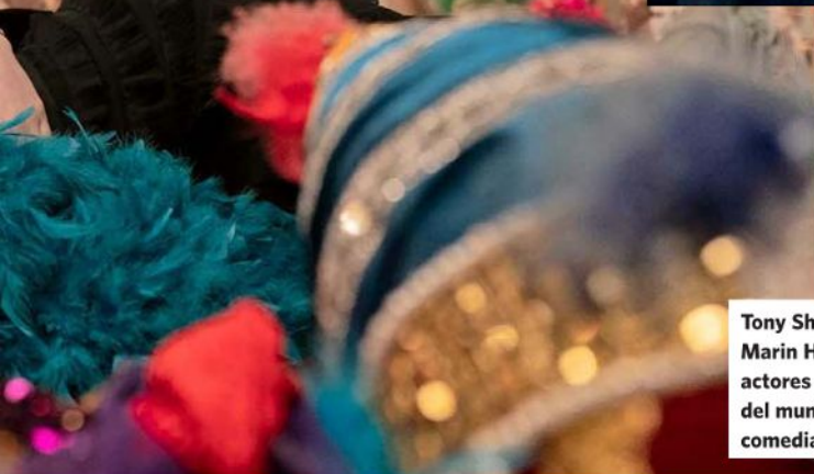
Tony Shalhoub y Marin Hinkle son actores que vienen del mundo de la comedia.