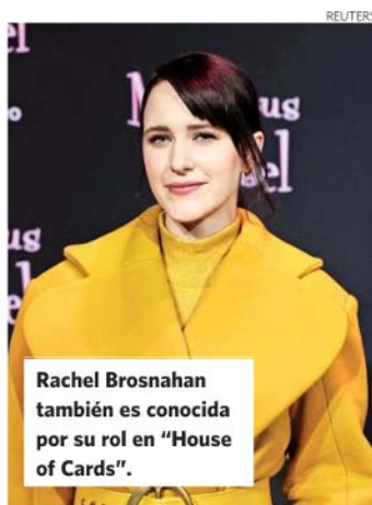
Rachel Brosnahan también es conocida por su rol en "House of Cards".

y no se puede dejar de notar cierta similitud entre su personalidad un poco seca con la del personaje que interpreta.