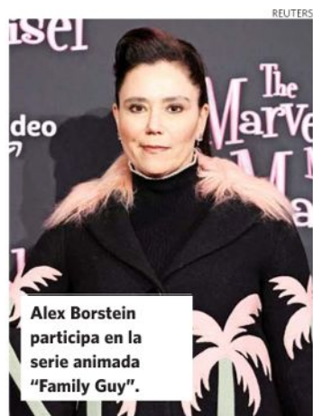
Alex Borstein participa en la serie animada "Family Guy".