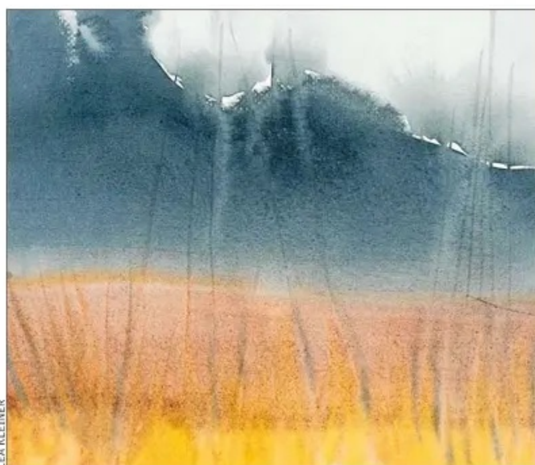
Lea Kleiner: "Aurora Boreal", el minimalismo y la belleza marcan su obra donde el agua es la protagonista.

Las exposiciones abarcaron su faceta más desconocida de fotógrafa en la que ya capturaba el agua como motivo. La segunda gran muestra fue con sus evocadores y minimalistas paisajes en donde son esenciales la poesía y la estética japonesa. Y entre sus últimos libros sobresale el que complementa con su refinado color a la gran poeta Emily Dickinson, en "Zumbido".