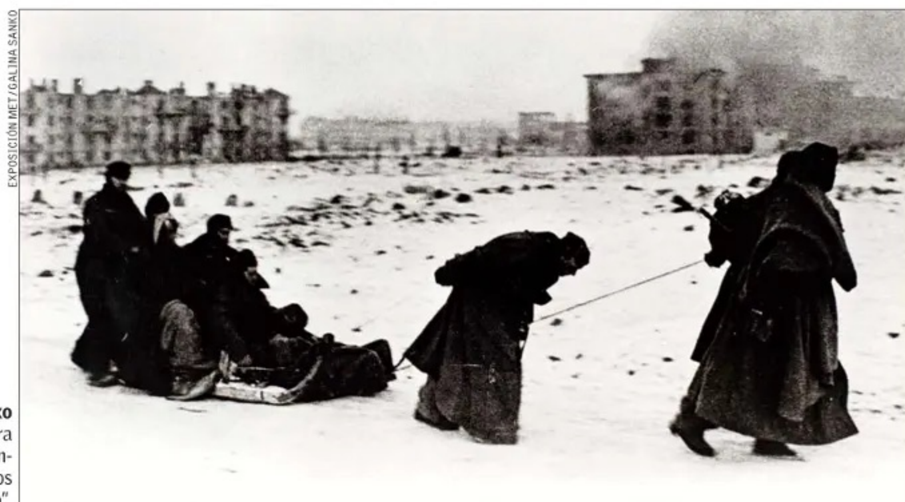
Galina Sanko fotoreportera rusa en el frente: "Prisioneros en Leningrado".