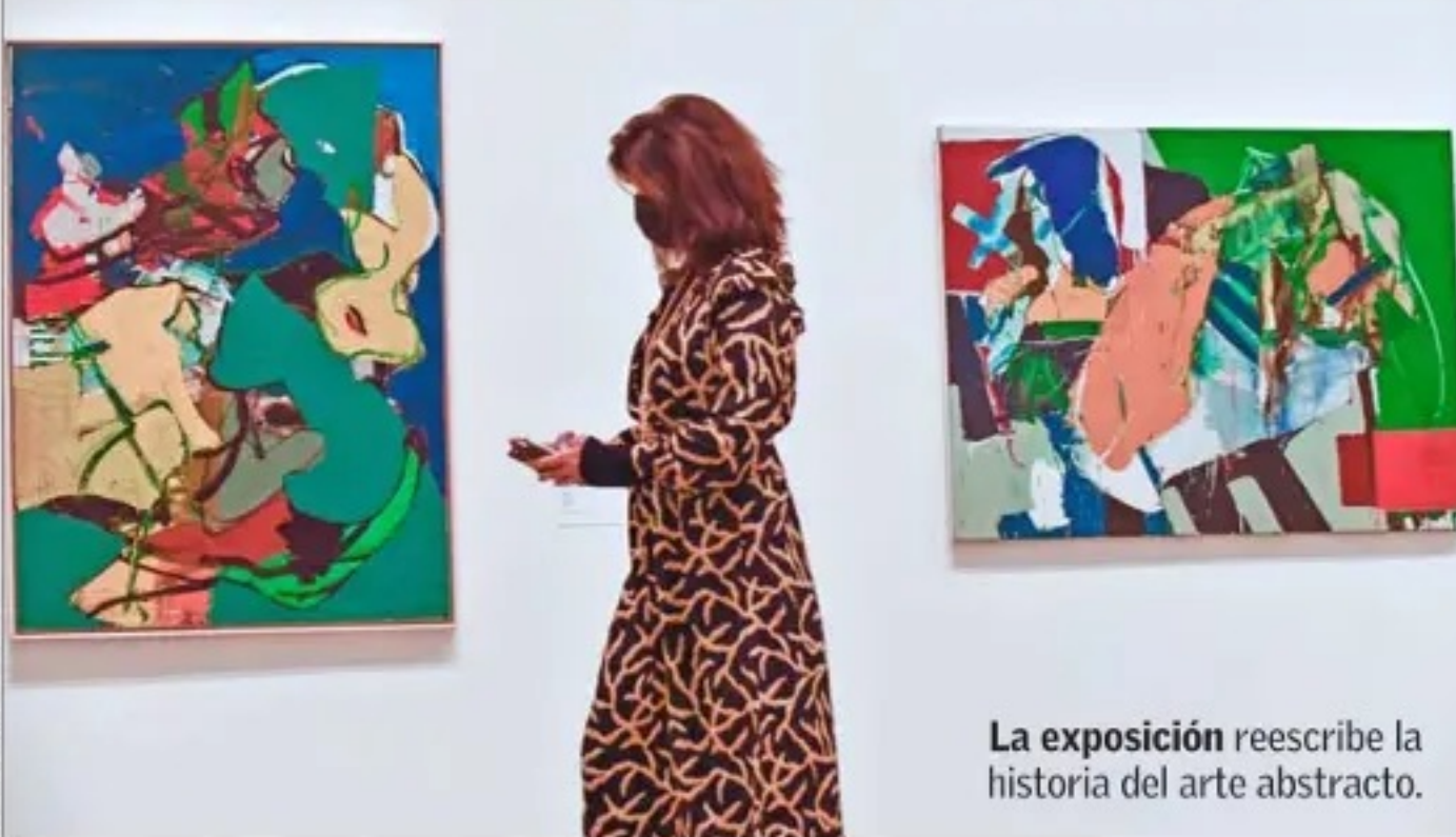
La exposición reescribe la historia del arte abstracto.

Cuesta creer varias de estas historias: de artistas notables que, incluso, fueron copiadas por cercanos famosos y después ignoradas. O las que fueron borradas por la crítica. El Guggenheim de Bilbao inauguró hace unos meses (sigue hasta febrero) esta reveladora muestra internacional sobre más de 100 mujeres —a través de 500 obras— que cultivaron el arte abstracto entre 1860 y 1960, pero que fueron invisibilizadas. Está el caso de Georgina Houghton, quien ya a mediados del 1800 se acercó al simbolismo de la abstracción. O el de la pintora inglesa Helen Sanders, que integró un grupo de vanguardia en 1914 que fue acallado por la guerra y sus pinturas fueron escondidas por 80 años. Más reciente es lo sucedido con pioneras de la Escuela de Nueva York: Janet Sobel —descubierta por Peggy Guggenheim, figura clave en estos rescates—, fue la primera en usar la técnica del chorreo que tomó Pollock: "El la observaba y la imitaba. Y el famoso crítico Clement Greenberg la ignoró y solo cuando Pollock despegó con su arte, la reconoció a medias: dijo que era una pintura primitiva. Los casos son muchos.