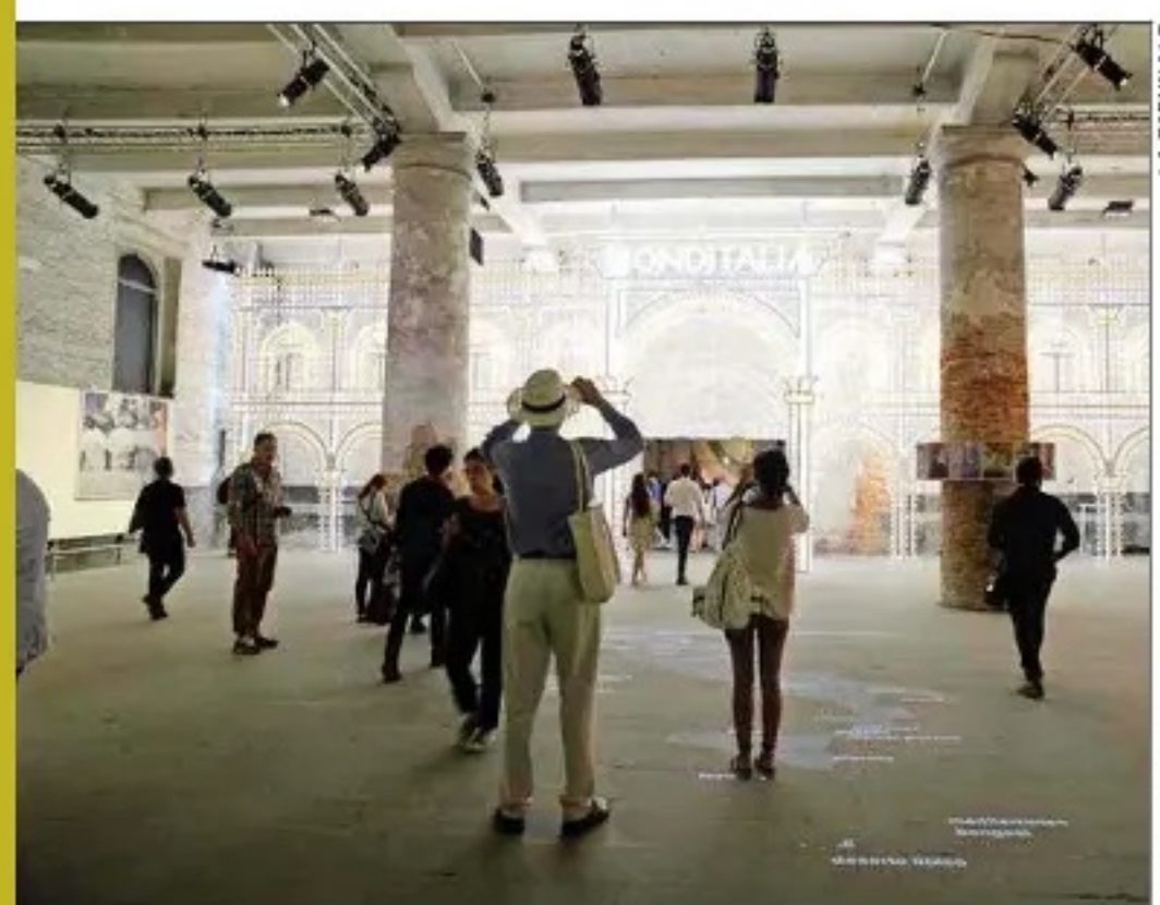
Invita a abordar fragilidades e incertidumbres del ser humano actual.