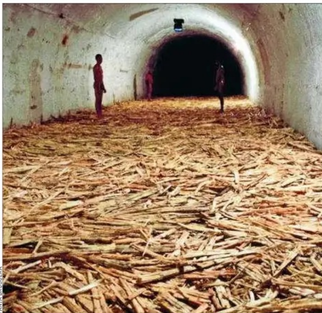
Instalación de Bruguera en que recreó túneles en Cuba por donde se llevaba a condenados políticos sin vuelta atrás. Expuesta en el MoMA.

Sus instalaciones y performances visibilizan la realidad y represión en Cuba. Bruguera ha sido vigilada, censurada y detenida numerosas veces, especialmente este año, cuando los cubanos han intentado salir a las calles masivamente para pedir libertad. Pero el Instituto de Artivismo Hannah Arendt en La Habana —que ella fundó y lidera— sigue apoyando al arte y al movimiento disidente San Isidro, a lo que han adherido numerosas figuras culturales del mundo. Además, ese instituto fue invitado a participar en la próxima Documenta de Kassel 2022. Mientras tanto, las temerarias obras de Bruguera (en que recrea, por ejemplo, túneles por donde llevan a presos políticos) se cuentan entre las más interpeladoras vistas en museos como el MoMA o el Tate Modern. Involucran el cuerpo y el intelecto.