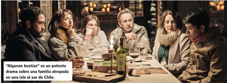
"Algunas bestias" es un potente drama sobre una familia atrapada en una isla al sur de Chile.