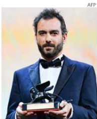
El director Théo Court triunfó en el Festival de Venecia y de Toulouse.