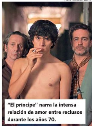
"El príncipe" narra la intensa relación de amor entre reclusos durante los años 70.