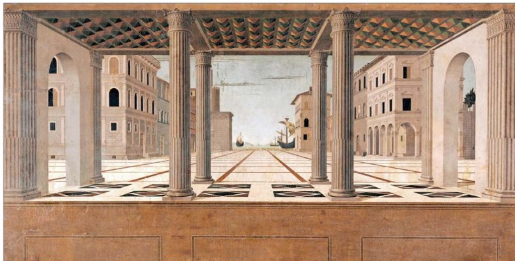
LIBRO UCV “La Ciudad ideal”, pintada alrededor de 1477 (autor desconocido), hoy en Gemäldegalerie, Berlín. El centro de ella era el ser humano y comprendía una vía de circulación acuática, otro nivel más alto para los peatones, carruajes y carretas y la gran plaza central.