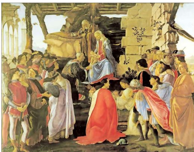
LIBRO UCV Botticelli. En “La adoración de los reyes magos” se autorretrató en primera fila (a la derecha), mirando al espectador y “dando cuenta de su cercanía con los Médicis”.

Fue ese grupo de intelectuales, arquitectos y artistas de Florencia, del Primer Renacimiento, los que dieron imagen a la idea.