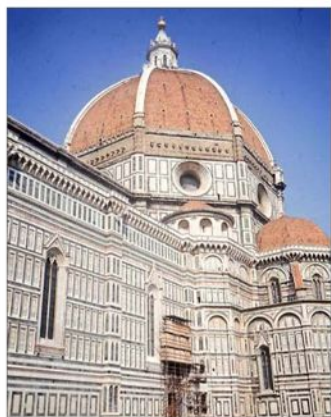
Brunelleschi autor de la Cúpula en el Duomo. “Fue el alma pensante del siglo XV”.