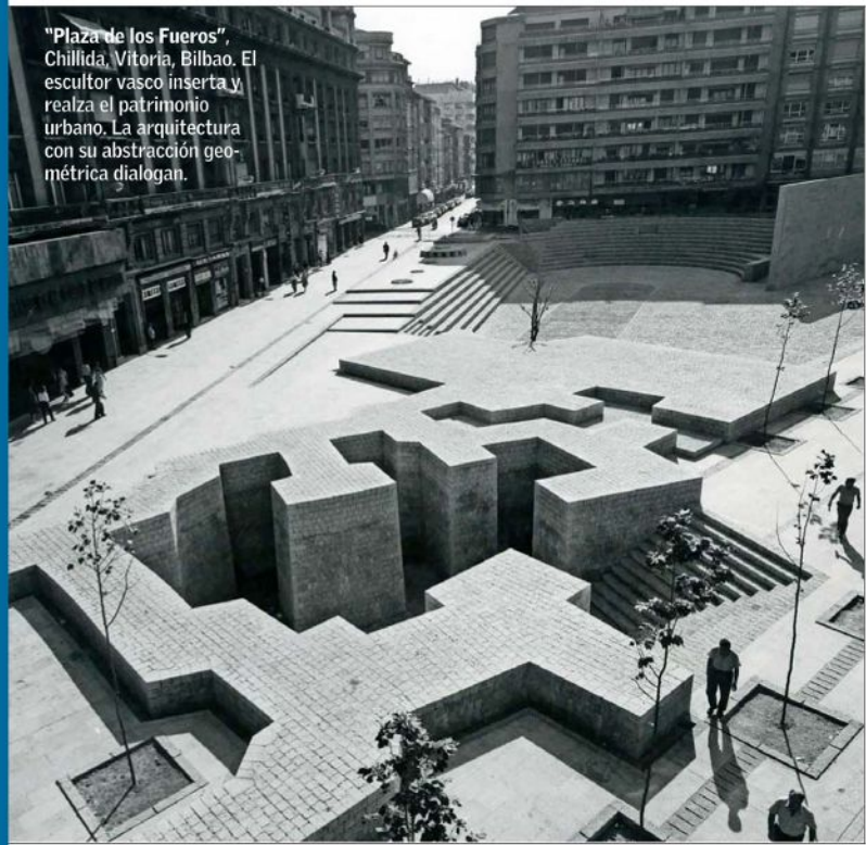
"Plaza de los Fueros", Chillida, Vitoria, Bilbao. El escultor vasco inserta y realiza el patrimonio urbano. La arquitectura con su abstracción geométrica dialogan.

de uno de los pasajes de más interés de Chillida, pues proyectó y emplazó obras y monumentos en medio de la arquitectura, del patrimonio natural e histórico del Viejo Mundo. Y emplazó obras en "Honor a la luz", a la música. Está su "Elogio del agua".