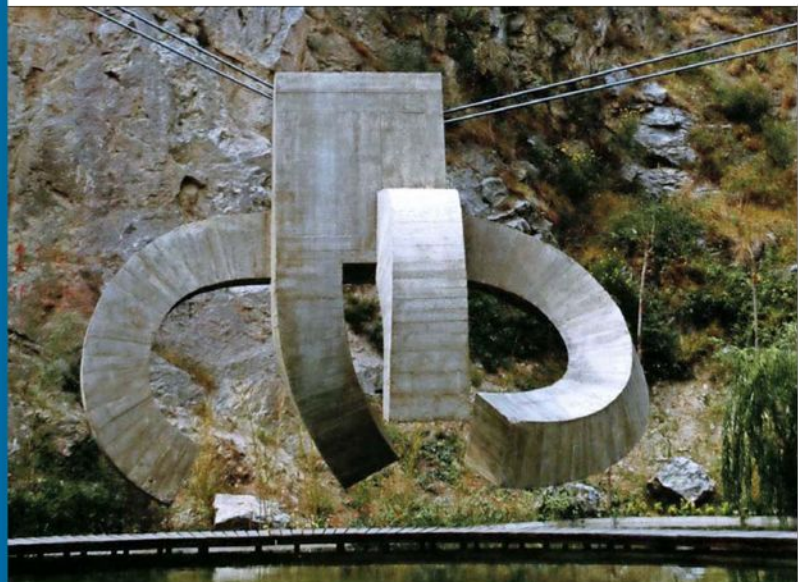
"Elogio al agua", Barcelona. La materia y el vacío, la gravedad, son constantes. "Mi concepción del espacio tiene una dimensión espiritual", señalaba.

100 AÑOS | Entre un enigma estético y un asombro poético