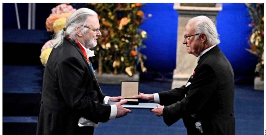
Jon Fosse recibió el Premio Nobel de Literatura el pasado 10 de diciembre, de manos del rey Carlos XVI Gustavo de Suecia.