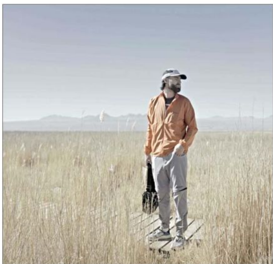
El futbolista recorrió con esta producción cuatro ciudades chilenas.