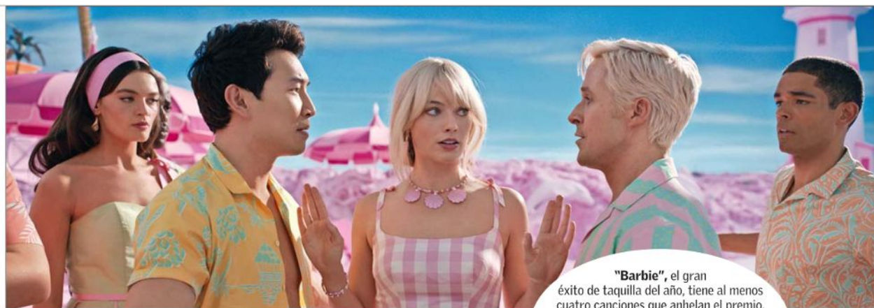
"Barbie", el gran éxito de taquilla del año, tiene al menos cuatro canciones que anhelan el premio.