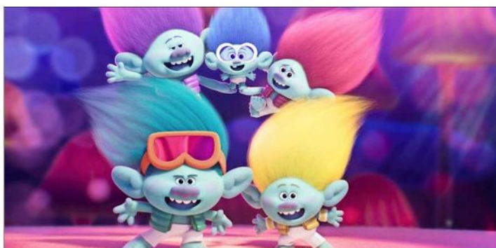
"Trolls 3: Se armó la banda" competirá con "Better place", el regreso de NSYNC.

En todo caso, las reglas de la Academia son estrictas: un máximo de tres canciones por película pueden ser sometidas a consideración y de ellas solo dos pueden terminar en la quina de nominadas. Y el equipo de "Barbie" ha pasado semanas tratando de elegir aquel trío de temas. Sin embargo, la decisión ya debe estar tomada: el plazo de la Academia de Hollywood vence hoy.