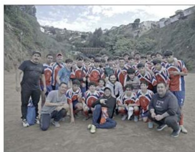
La idea de la serie surgió cuando Brereton expresó querer conocer más de Chile al filmar un comercial.

El propio Brereton compartió en la ocasión que su plato favorito durante el viaje fue "un asado que tuvimos en Pucón con amigos y familia. La carne estaba increíble y deliciosa, y también comimos un pescado que estaba muy bueno".