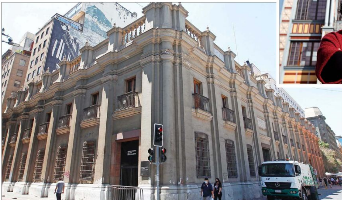
Fachada del Museo Chileno de Arte Precolombino. Su subvención se redujo en 40 millones de pesos.

En reunión de concejales se aprobó una merma de recursos para este año. Desde la Municipalidad de Santiago señalan que decidieron redistribuir la subvención a otros agentes culturales que, con anterioridad, no habían recibido aportes.