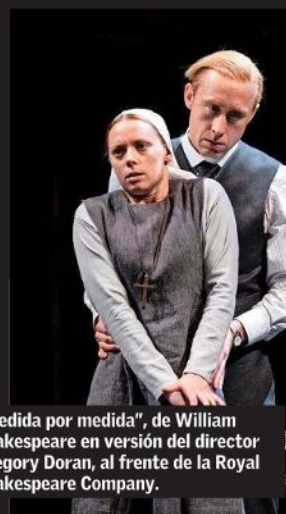
"Medida por medida", de William Shakespeare en versión del director Gregory Doran, al frente de la Royal Shakespeare Company.

tora Polly Findlay, al frente de la Royal Shakespeare Company, no solo da a la obra un ritmo de película de terror, con guiños a "El resplandor" de Stanley Kubrick, sino que propone una suerte de corolario que no está en Shakespeare, haciendo aparecer al final a las brujas profetisas del inicio —representadas por tres niñas con muñecas en sus brazos— pa-