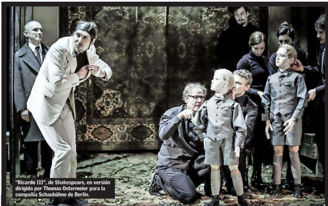
"Ricardo III", de Shakespeare, en versión dirigida por Thomas Ostermeier para la compañía Schaubühne de Berlín.

El gran director inglés Peter Brook da en el clavo. Para él no es tema esto de reescribir un texto de Shakespeare. Eso jamás lo pondría en duda. "Toda persona puede hacer con un texto lo que crea necesario, sin que nadie padezca. Lo importante es el resultado", ha dicho. Lo fundamental, entonces, es que el trabajo sea de