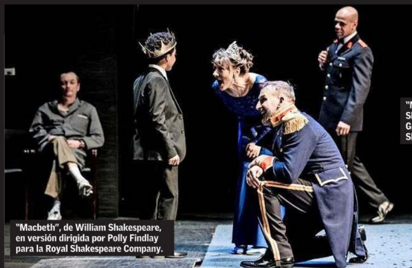
"Macbeth", de William Shakespeare, en versión dirigida por Polly Findlay para la Royal Shakespeare Company.

Las seis puestas en escena basadas en las obras del bardo que se incluyen en la temporada 2022 del Festival Internacional Teatro a Mil son muestra de la inagotable variedad de opciones que se desprende de sus páginas y de cómo sus historias encarnan pulsiones y conflictos de pleno vigor en el siglo XXI.