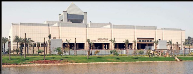
El Museo Nacional de la Civilización Egipcia se ubica en la histórica zona musulmana de Al-Fustat, junto a un lago natural.