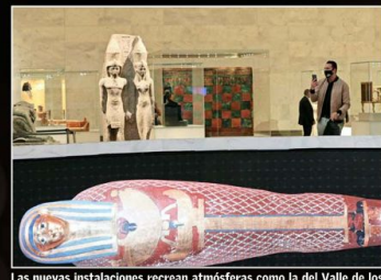
Las nuevas instalaciones recrean atmósferas como la del Valle de los Reyes, la necrópolis en donde fueron encontrados estos faraones.