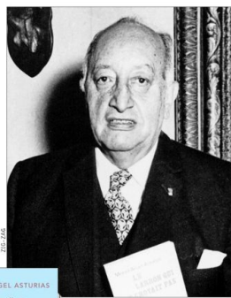
Miguel Ángel Asturias escribió su novela en París, donde vivió cerca de diez años, y la publicó en 1946.

Lo curioso de aquel encuentro es que se produjo el mismo año en que el premio Nobel recayó en Asturias, uno de los precursores del boom y cuya obra "El señor presidente" lo sitúa entre los máximos exponentes de la "novela de dictadores". El germen de este libro fue su cuento "Los