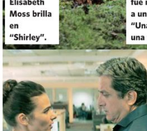
Judith Chemla fue nominada a un César por “Una mujer, una vida”.