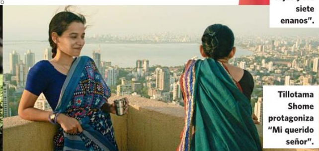
Tillotama Shome protagoniza “Mi querido señor”.