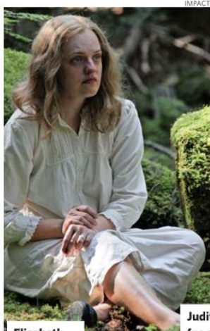
Elisabeth Moss brilla en “Shirley”.

En esta versión, alejada de la vida real, Shirley Jackson recibe en su casa a Fred (Logan Lerman) y Rose (Odessa Young),