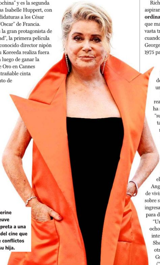
Catherine Deneuve interpreta a una diva del cine que tiene conflictos con su hija.

"Un fantástico duelo de actrices entre Juliette Binoche y Catherine Deneuve, hija y madre, que además incluye varias capas de cebolla metalingüísticas, pues ambas deben actuar bien, regular e incluso mal, dependiendo del grado de efectividad de sus mentiras, ya sean personales o profesionales", dijo la crítica de El País.