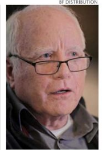
Richard Dreyfuss, conocido por su rol en "Tiburón", es un aspirante a astronauta.

En esta disparatada comedia de humor negro, De Niro interpreta a Max Barber, un productor de cine de Hollywood venido a menos. Tras el fracaso de su última película y ante la presión de devolver el dinero a un jefe de la mafia local (encarnado por Morgan Freeman), encuentra una particular solución a sus problemas económicos: producir una nueva película, esta vez con escenas de acción de alto riesgo, con el fin de provocar la muerte del protagonista y así poder cobrar la elevada cifra del seguro. El actor elegido para la "misión" es Duke Montana (Tommy Lee Jones), una vieja estrella del cine que se encuentra deprimida, pero que, contra todo pronóstico, durante la filmación no solo encuentra una motivación para vivir, sino la fuerza suficiente para enfrentar los peligrosos retos.