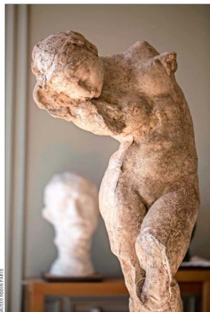
Rodin protagonizará dos inéditas muestras. Una de ellas, en el Tate Modern, se internará en sus pasiones, en su proceso de obra.