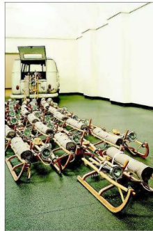
Beuys citaba su accidente como piloto nazi en la Segunda Guerra en las camillas con fieltros.

MUSEOS DEL EXTERIOR | Se proyectan en "modo presencial", a pesar de rebotes