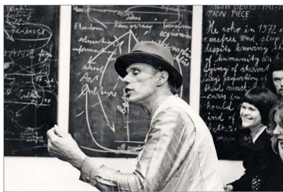
Joseph Beuys cambió radicalmente la manera de enseñar el arte, que para él era una herramienta de construcción social. Hizo también desgarradoras acciones sobre ello.