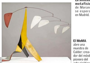
El MoMA abre una muestra de Calder: creador del móvil, pionero del arte cinético.