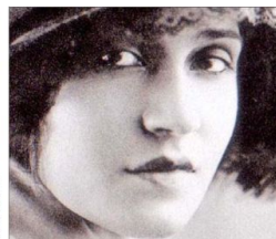
La fotógrafa y activista italiana Tina Modetti es solo "una de las que llegan" a revolucionar el Met.