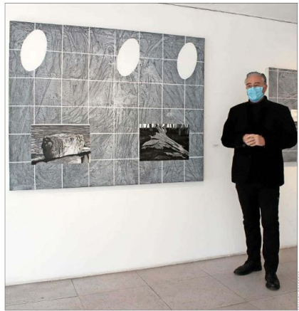
"Tierra ignota" le fue mostrando en terreno la depredación en la historia reciente, la huida del puma y el hundi, y la fuerza de la naturaleza. Antes navegó en la Amazonía.