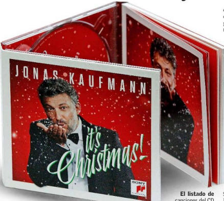
El listado de canciones del CD recorre varios siglos de música navideña.

peos y que debió ser cancelada debido al rebote del covid-19. Eso sí, se hizo un especial de televisión rodado en Salzburgo que será transmitido durante diciembre.