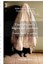
Publicado por Ediciones Metales Pesados, el libro cuesta $10.600.