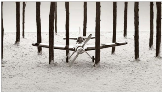
El artista español conduce con sus genuinas fotografías a un mundo de sueños, fantasías, y también de historias e intelecto. Plasma nuevas realidades ("Avión en un bosque"), las que son leídas libremente según cada espectador.

ENTREVISTA Ícono de la fotografía actual