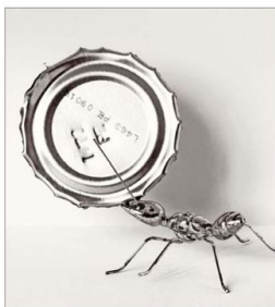
Juega con los objetos y sus significados como con esta hormiga. Lee también mucho y trabaja con poetas.

cado que está latente en el objeto y que la fotografía trata de traer a un primer plano como un elemento más de trabajo. No se puede evitar su presencia si lo que uno pretende es aprovechar la resonancia interior que provoca. Y por otro lado, la metáfora vendría a reforzar esta idea al facilitar que algo que no está presente en la imagen forme parte de ella".