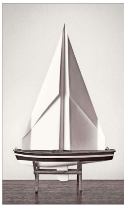
Maddoz hace arte. En muchas ocasiones trabaja, antes, una suerte de objeto escultórico: "Bote vela".