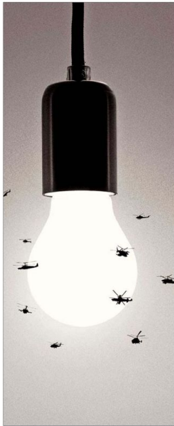
Para "Helicópteros volando alrededor de una bombilla" hizo una pequeña y asombrosa construcción.

El ser humano, aunque casi no aparece, es esencial en mi obra: en estos objetos está él, están sus sueños, sus necesidades, sus deseos".