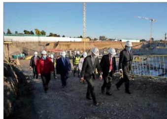
INFRAESTRUCTURA.— En Chillán se levanta el nuevo Hospital Regional de Ñuble. El mayor proyecto de inversión pública en la jurisdicción.