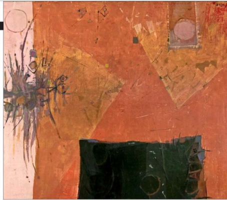
"EL SUEÑO DE LA GITANA", 1961. Óleo de Bonati cuando en Chile primaba el posimpresionismo.

ENTREVISTA | Figura mítica del arte revela pasajes de su historia