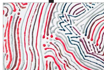
ACRÍLICO 2020, una de sus últimas pinturas sintéticas.

—Tengo un sueño que no he podido concretar y me encantaría: es vivir en un puerto pequeño en España. Tener un taller muy grande y vivir cómodo a unos 60 metros sobre el nivel del mar, para protegerme de la subida de las aguas", ríe, más silencioso.