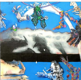
"ESTE LORO NO DESTIÑE", 1980. El artista da rienda suelta a su humor y sátira hacia la sociedad y personajes reales y ficticios.

Es el único sobreviviente del Grupo Signo, considerado el primer movimiento genuino de arte moderno en nuestro país. Es también el autor de emblemáticos murales en Chile y celebradas obras en España, donde vivió durante décadas. Hoy, a sus 89 lúcidos años, el también teórico de la percepción, sigue creando. La Academia le otorgó el premio Marco Bontá.